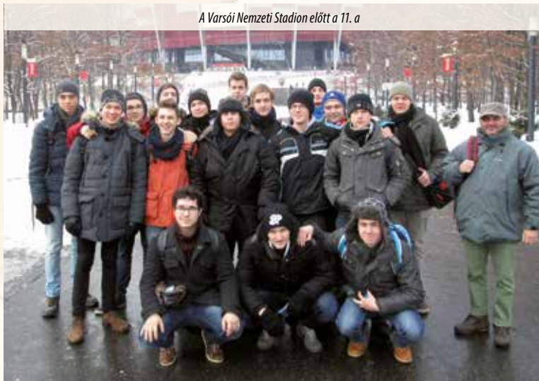
A Varsói Nemzeti Stadion előtt a 11. a

22 Az első fél év utolsó tanítási napja volt.