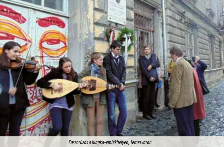
Koszorúzás a Klapka-emlékhelyen, Temesváron