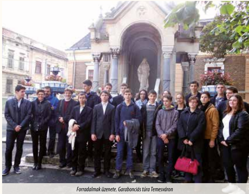
Forradalmak üzenete. Garabonciás túra Temesváron

Forradalmak üzenete testvériskolai program keretében Temesvárra utazott egy diákcsoport.