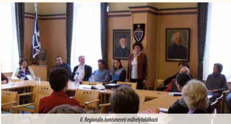
II. Regionális honismereti műhelytáldkozó