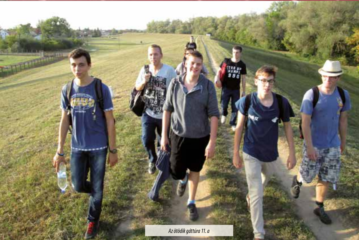
Az ötödik gáttúra 11. a