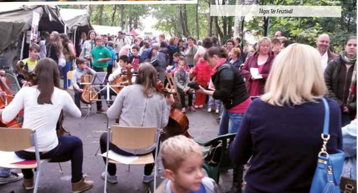
Tágas Tér Fesztivál