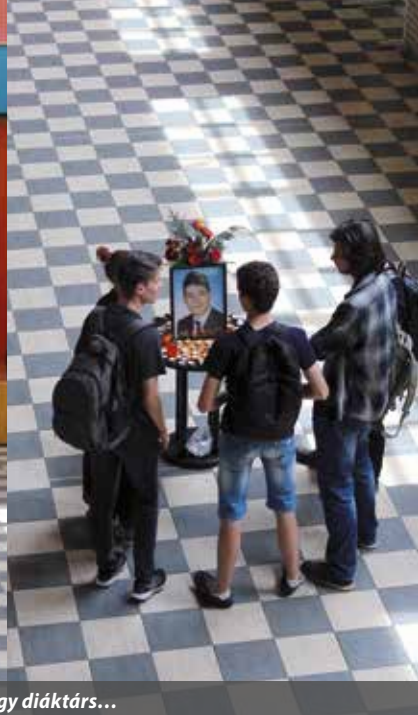
Meghalt egy diáktárs...