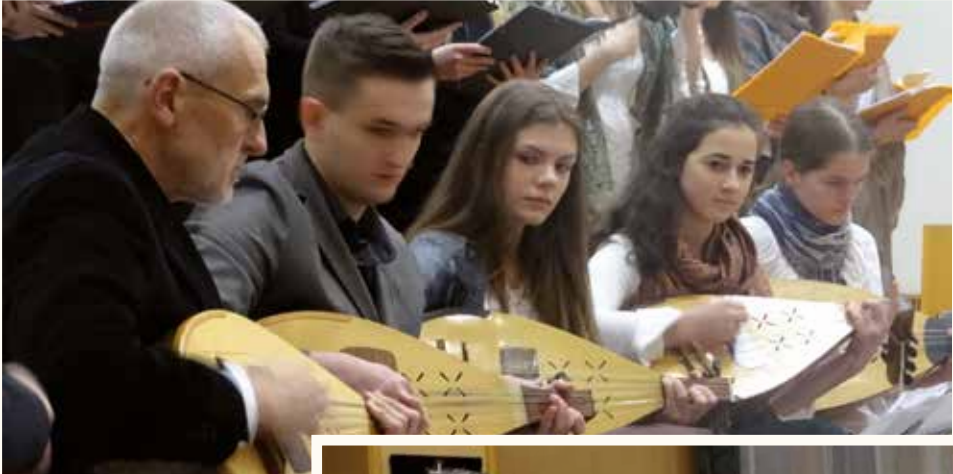
Közös fellépés a cambridge-i kórossal