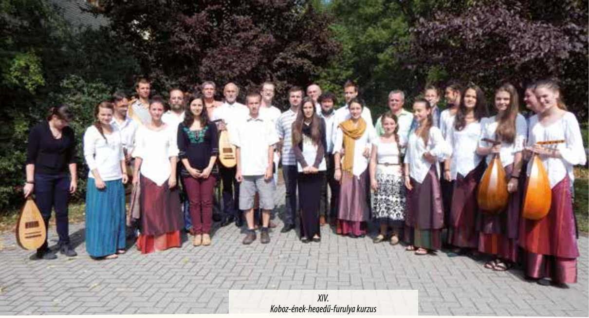
XIV. Koboz-ének-hegedű-furulya kurzus