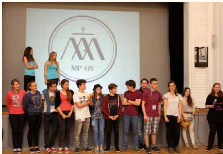
Piarista Ifjúsági Találkozó Vácott