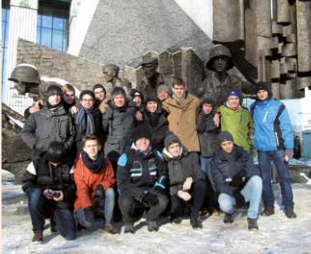
A varsói felkészés emlékműve előtt a 11. a