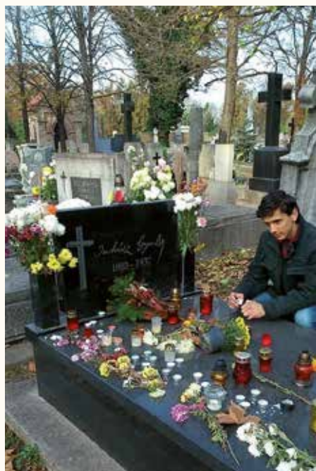
Koszorúzás a piarista síroknál, a Belvárosi temetőben