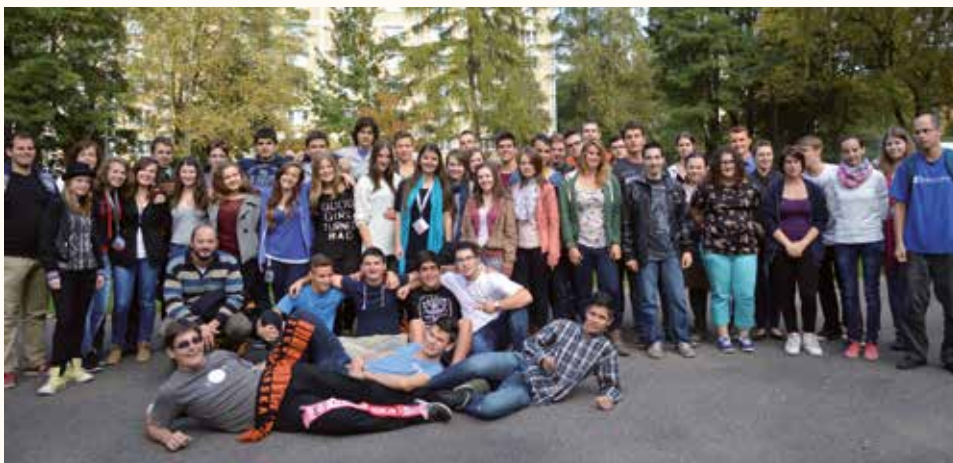
Krakkói piarista ifúsági találkozó