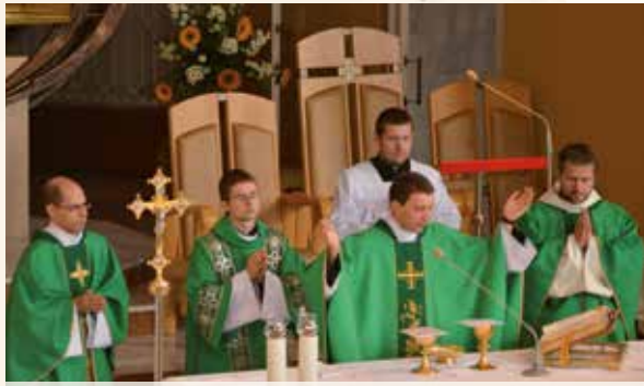
Szentmise a karkkói találkozón

Péntek reggel indult útnak a csapat, majd szépen sorban felvettük az ország különböző helyeiről érkező piarista diákokat Kecskeméten, Budapesten (itt szálltak fel a mosonmagyaróváriak is) és Vácot. A Felvidéken megálltunk egy csodálatos síparadicsomnál, hogy kinyújtsuk megfáradt lábainkat. Végül 11 óra feledhetetlen buszút után végre megláttuk úti célunkat, Krakkó csodálatos városát. A köszöntő után elfogyasztottuk a vacsorát, majd egy esti közös imán vettünk részt, amiből mi, magyarok sajnos nem sokat értettünk a fordítás hiánya miatt. Szombaton ismét közös imával kezdtük a napot, majd külön csoportokban beszélgettünk, ki magyarul, ki angolul. Ebéd után bementünk a belvárosba, ahol közel négyórás szabad programunk volt, mindenki azt csinált, amit akart. Ezt követően visszamentünk az iskolába, ahol volt egy ünnepi szentmise, utána vacsora, majd zenés program. A zenés mulatságban felléptek az atyák is. A diákok nem voltak megijedve a piaristák hatalmas pogójától, sőt még ők is rátettek egy lapáttal. Az esti bulizást csendes szentségimádás követte. Ezzel záródott a szombat este. A vasárnapi reggelit követően elmentünk egy gyönyörű templomba, és részt vettünk egy