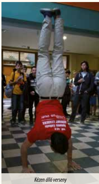
Kézen álló verseny