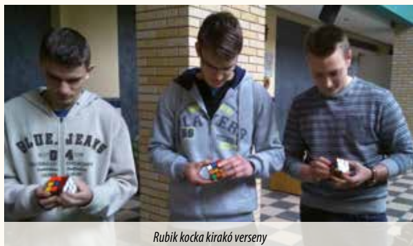
Rubik kocka kirakó verseny