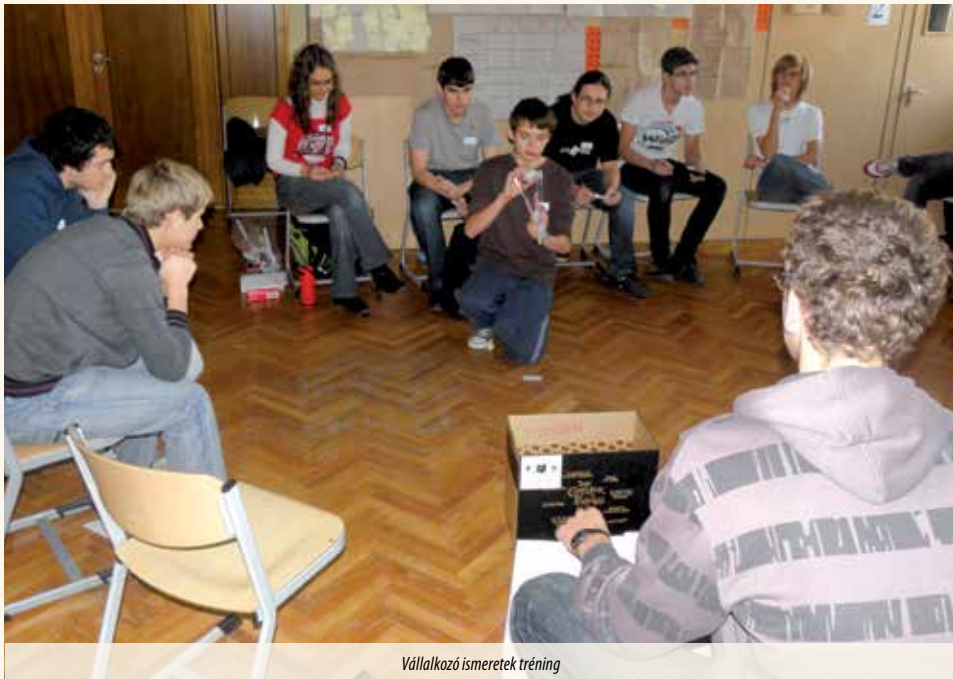
Vállalkozó ismeretek tréning