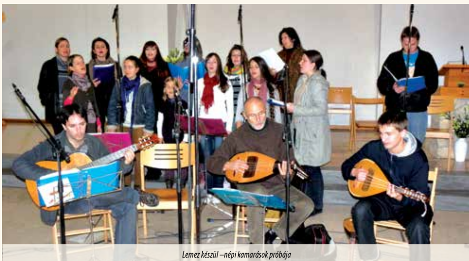
Lemez készüül – népi kamarások próbája