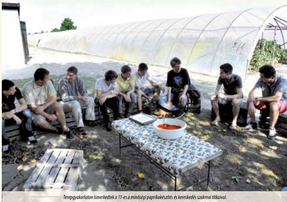
Terepgyakorlaton ismerkedtek a 11-es a minőségi paprikakészítés és kereskedés szakmai titkaival.