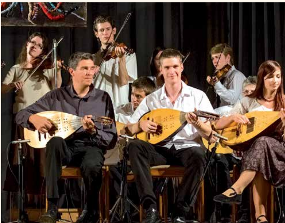
Gyökerek – koncert