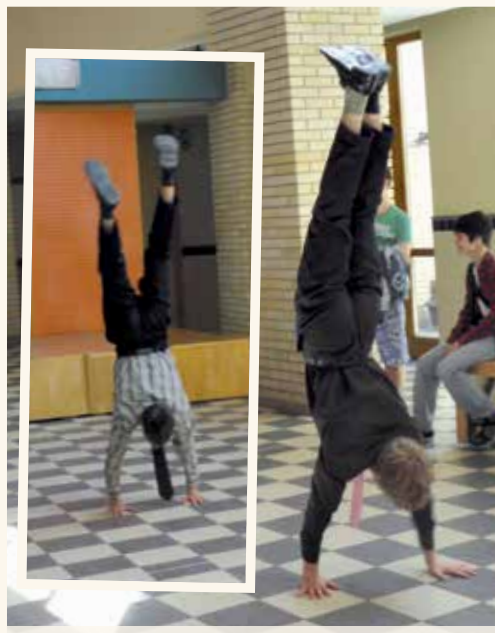
Kézen álló verseny