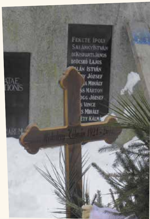
Meghalt a legidősebb pianista