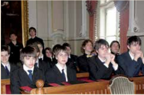
A leendő városatyák

más világ. E két helyen a 18. század eleje óta folyamatosan működik a piarista iskola. A szocializmus korában az egyházi iskola elitiskola lett, hiszen csak egy szűk kör érthette el, a diákok motiváltak voltak, tudták, érettségi után nem biztos, hogy a továbbtanulás egyből sikerül, nagyon meg kellett küzdeniük az életért, a boldogulásért.