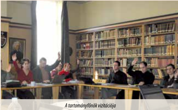
A tartományfőnök vizitációja

Tisztelt Dugonics Társaság! Tisztelt Tartományfőnök Atya! Kedves Hölgyeim! Tisztelt Uraim! Kedves Diákok!