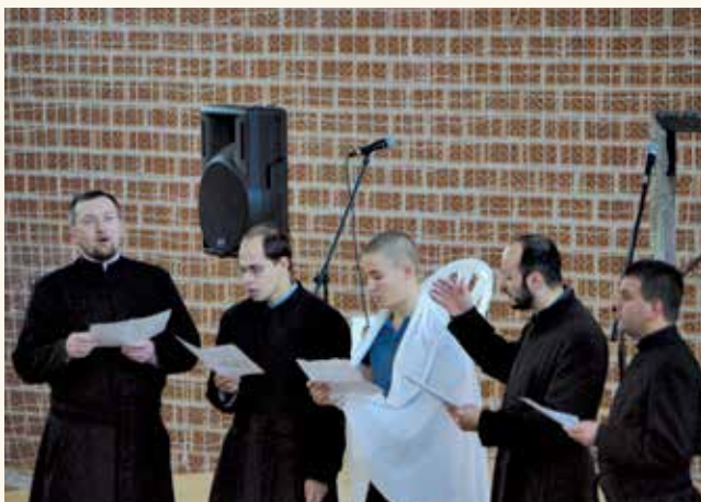
A rendház produkciója az osztálykarácsonyozás előtt