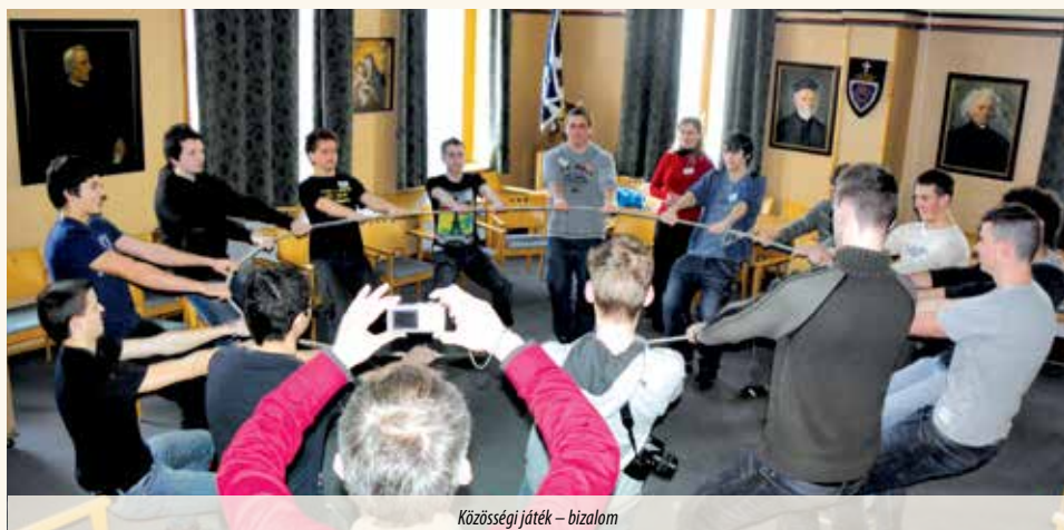
Közösségi játék – bizalom